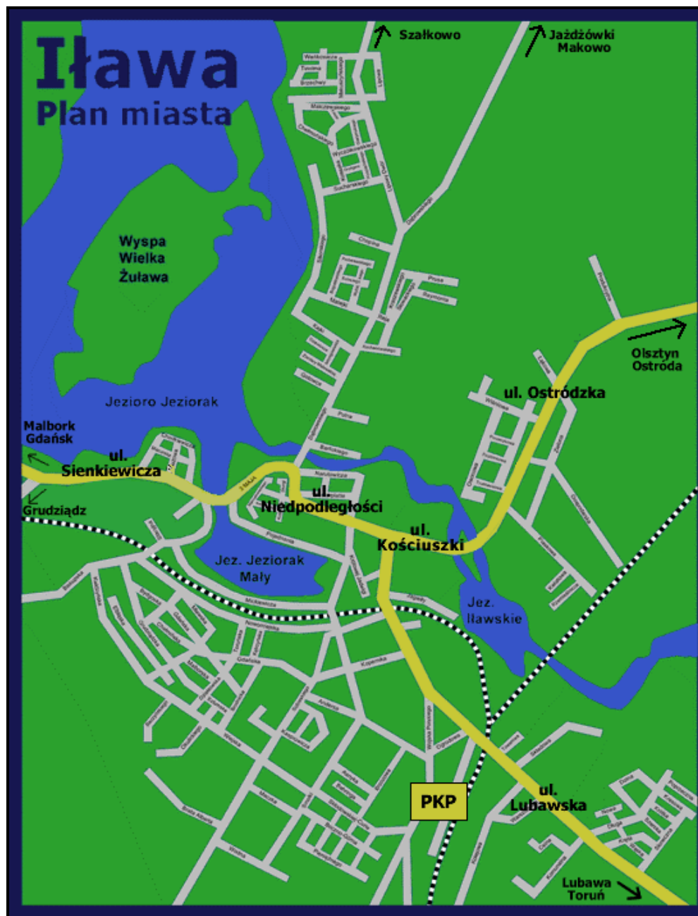
Rysunek 3. Mapa miasta Iławy

Według danych z UM (stan na 31.12.2015 r.) miasto zamieszkuje 33 264 mieszkańców.