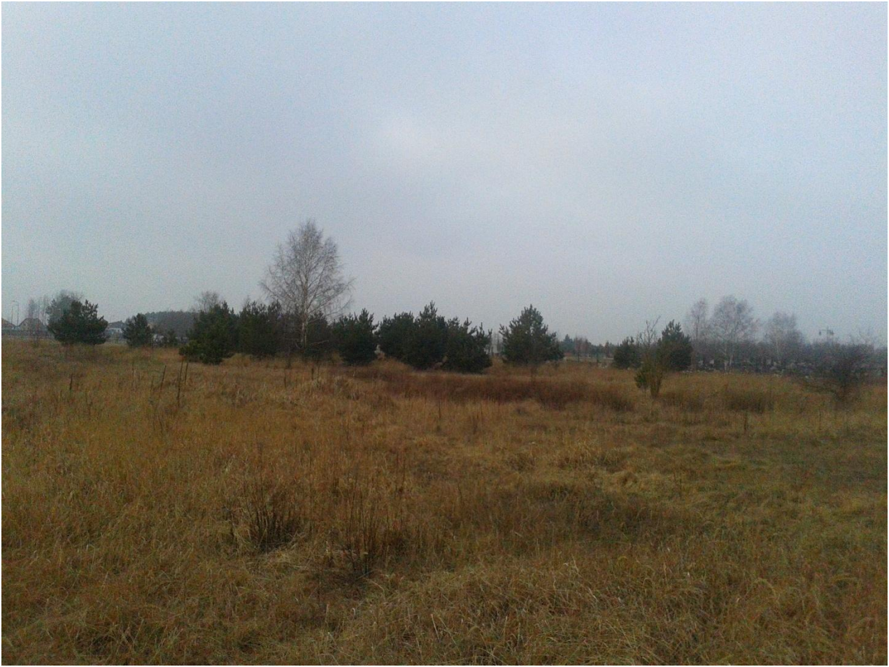
Fot.2. Od strony północno-wschodniej