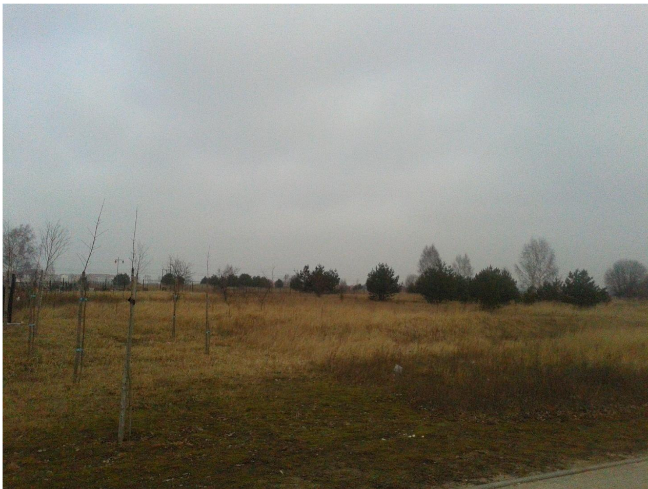
Fot.1. Od strony południowo-wschodniej