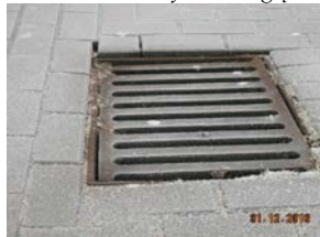
zaniżenie lub zawyżenie względem nawierzchni o 0,5 cm do regulacji