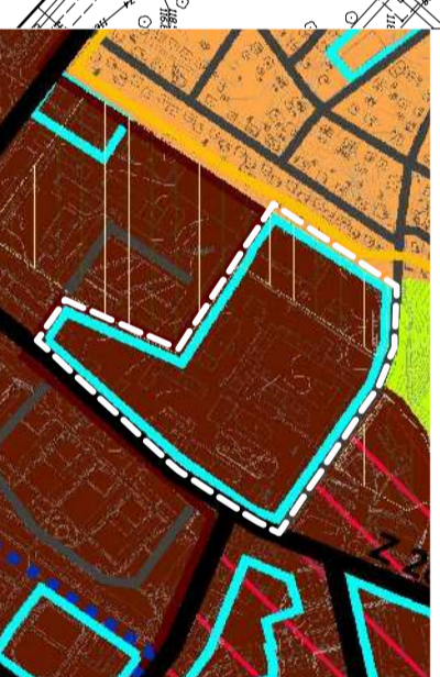
WYRYS ZE STUDIUM UMIAKUNKOWANI I KIERUNKÓW ZAGOSPODAROWANIA PRZEZ IZBENEGO MIASTA ŁAWA UCHWAŁA NR ..... Z DNIA .....