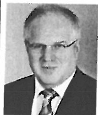
Liebe Mitbürgerinnen, liebe Mitbürger,

Herborn • Amdorf • Burg • Guntersdorf • Hirschberg • Hörbach • Merkenbach • Schönbach • Seelbach • Uckersdorf