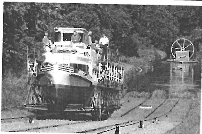
Wer zur Fußball-Europameisterschaft nach Ilawa fährt, sollte sich Zeit nehmen für die Sehenswürdigkeiten der Umgegend. Am Oberlandkanal locken die sogenannten Rollberge, durch die die Schiffe einen Höhenunterschied von rund 100 Metern überbrücken.