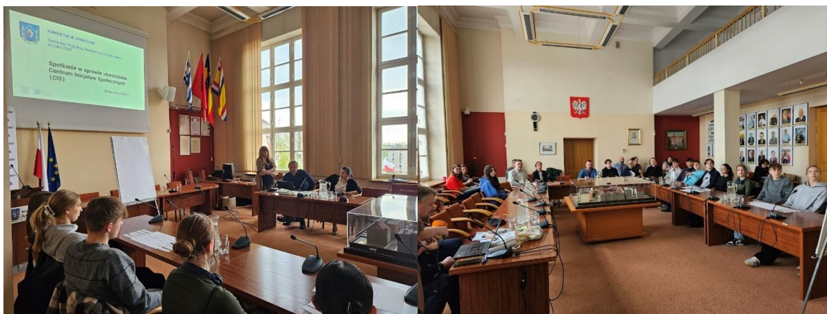
Ryc. 6 Spotkanie ws. CIS

Uwagi zostały uwzględnione w GPR - opisie przedsięwzięć. Część z potrzeb będzie zaspokajał nowy budynek biblioteki w ramach Domu Weterana (np. pokoje spotkań, sale edukacji elektronicznej).