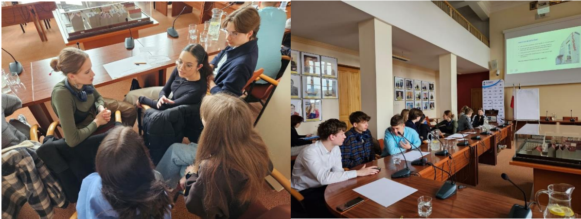
Ryc. 7 Spotkanie ws. CIS, praca warsztatowa