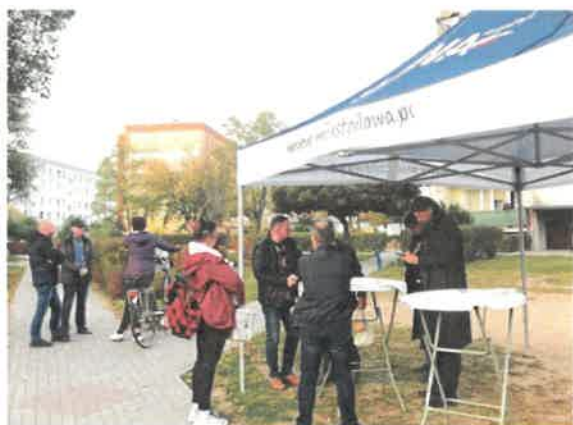
Ryc. 7 Konsultacje społeczne na osiedlu Podleśne.

W punkcie konsultacyjnym nie zostały zgłoszone uwagi odnośnie proponowanych przedsięwzięć, ujętych w projekcie GPR.