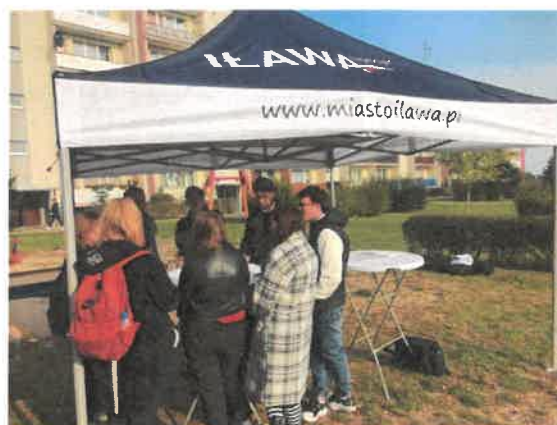
Ryc. 8 Konsultacje społeczne na osiedlu Podleśne.