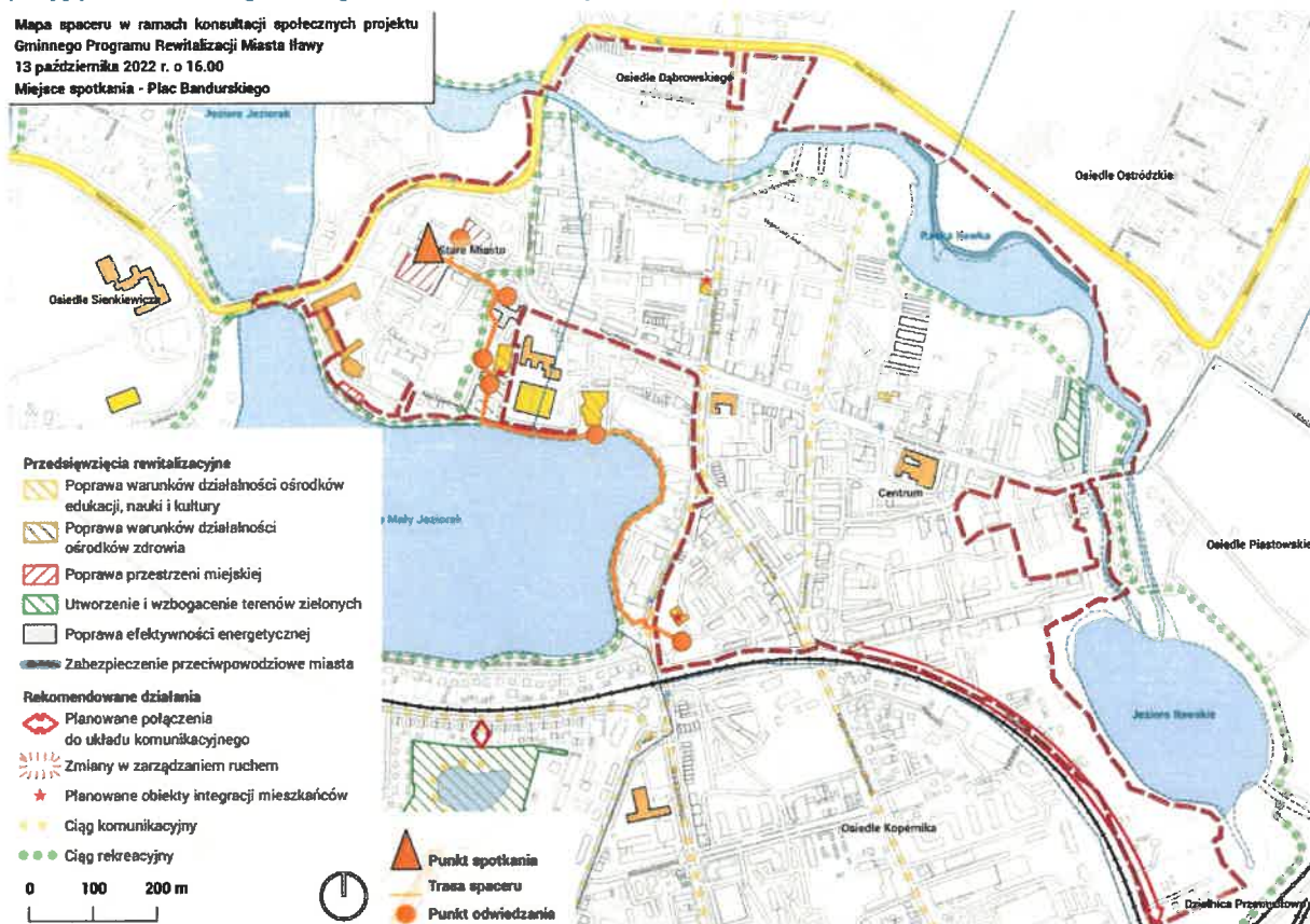
Ryc. 9 Mapa trasy otwartego spaceru po centrum miasta.

Mapa spaceru w ramach konsultacji społecznych projektu Gminnego Programu Rewitalizacji Miasta Iławy 13 października 2022 r. o 16.00 Miejsce spotkania - Plac Bandurskiego