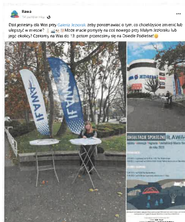
Ryc. 6 Podgląd udostępnienia informacji o konsultacjach społecznych w mediach społecznościowych

Dodatkowo 14 października w godz. 11:00 – 13:00 przeprowadzono otwarte spotkanie w formie punktu konsultacyjnego przy Galerii Handlowej „Jeziorak” (ul. Królowej Jadwigi 6). Mieszkańcy zostali o nim poinformowani przez media społecznościowe.