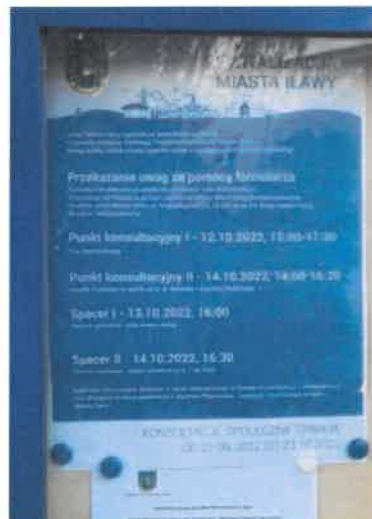
Ryc. 5 Podgląd plakatów

Zgodnie z wymaganiami określonymi w art. 6 ust 3 i 4 Ustawy, konsultacje społeczne zostały prowadzone w trzech następujących formach: