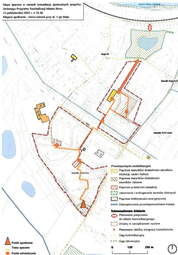
Ryc. 10 Mapa trasy otwartego spaceru po osiedlu Podlesie i Gajerek.

W czasie spaceru zwrócono uwagę na słabą dostępność CAL dla mieszkańców i organizacji pozarządowych. Poruszono kwestie zagospodarowania terenu w rejonie ul. Wiejskiej (połączenie ul. Wiejskiej z ul. Gdańską oraz zaadaptowanie budynku obok CAL na cele społeczne).