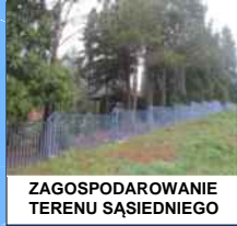
ZAGOSPODAROWANIE TERENU SĄSIĘDZIEGO