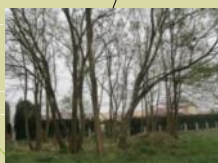
ZIELEŃ WYSOKA (ROBINIA AKACJOWA)