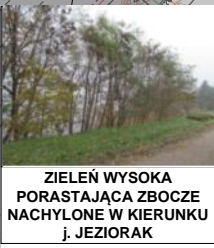
ZIELEŃ WYSOKA PORASTAJĄCA ZBOCZE NACHYLENE W KIERUNKU j. JEZIORAK