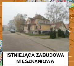
ISTNIEJĄCA ZABUDOWA MIESZKANIOWA