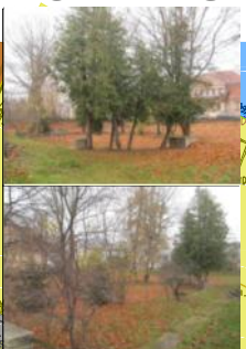
OGRÓD UJĘTY W REJESTRZE ZABYTKÓW