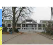
ZABUDOWA W FAZIE BUDOWY