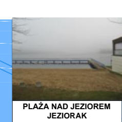
PLAŻA NAD JEZIOREM JEZIORAK