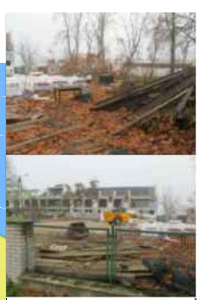
TEREN SĄSIADUJĄCY Z OBSZAREM OPRACOWANIA