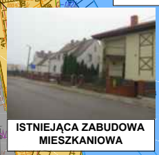
ISTNIEJĄCA ZABUDOWA MIESZKANIOWA