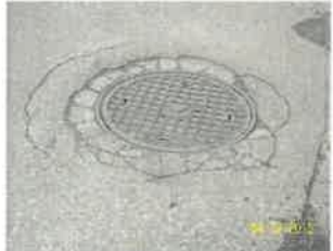
spękanie wokół studni