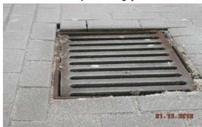
zaniżenie lub zawyżenie względem nawierzchni o 0,5 cm do regulacji