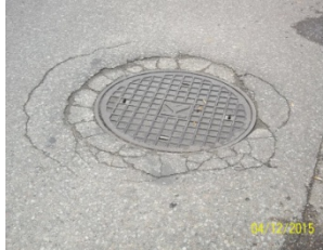
spękanie wokół studni