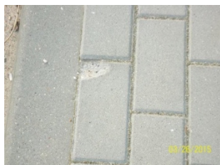
zaniżenie względem krawężnika , obrzeża poniżej 0,0 cm