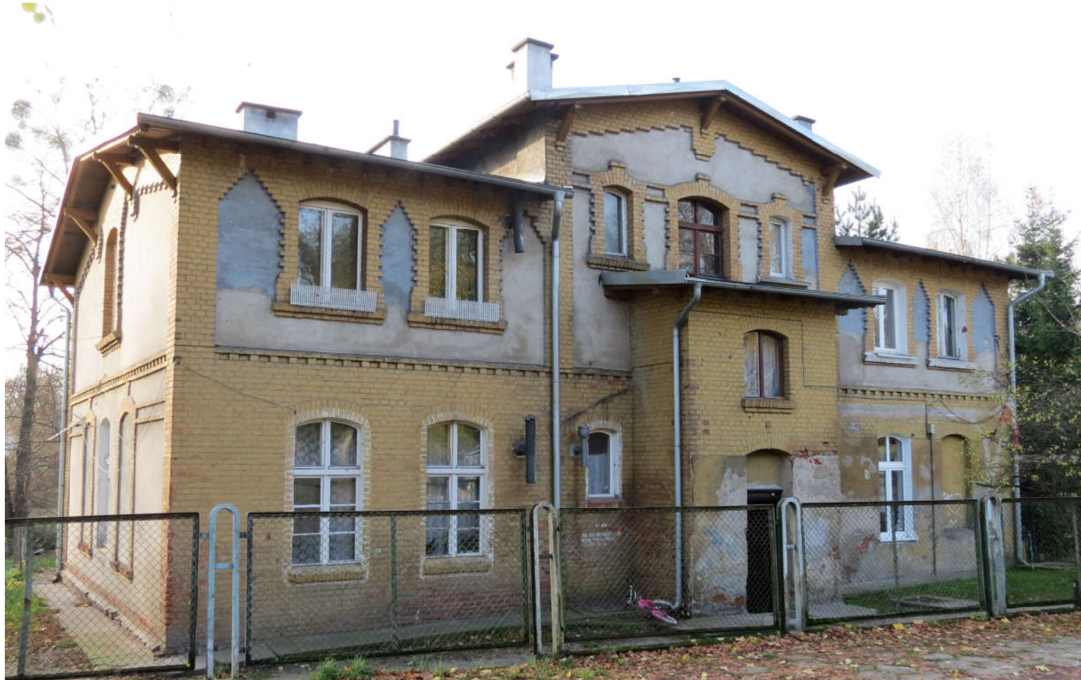
Widok ściany frontowej i szczytowej z NE na SW

8. Fotografia z opisem wskazującym orientację: