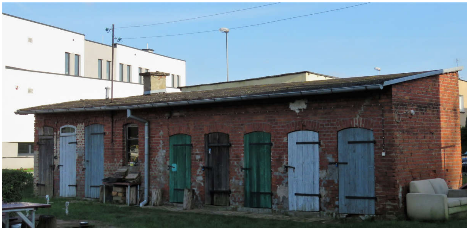
Widok ściany przedniej i szczytowej z SW na NE

8. Fotografia z opisem wskazującym orientację: