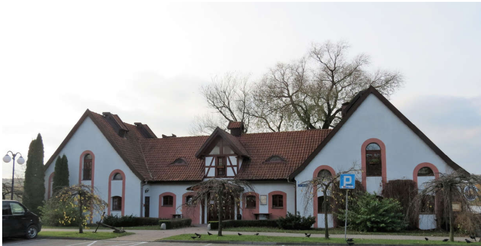
Widok ściany frontowej i ryzalitów z NE na SW

8. Fotografia z opisem wskazującym orientację: