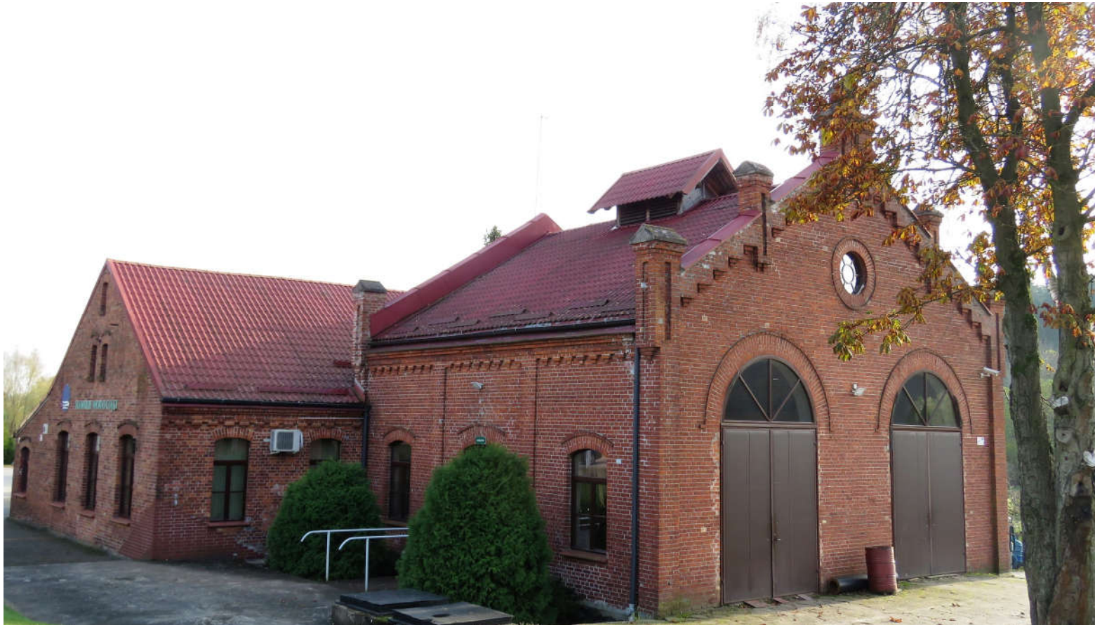
Widok bryły budynku z N na S

8. Fotografia z opisem wskazującym orientację: