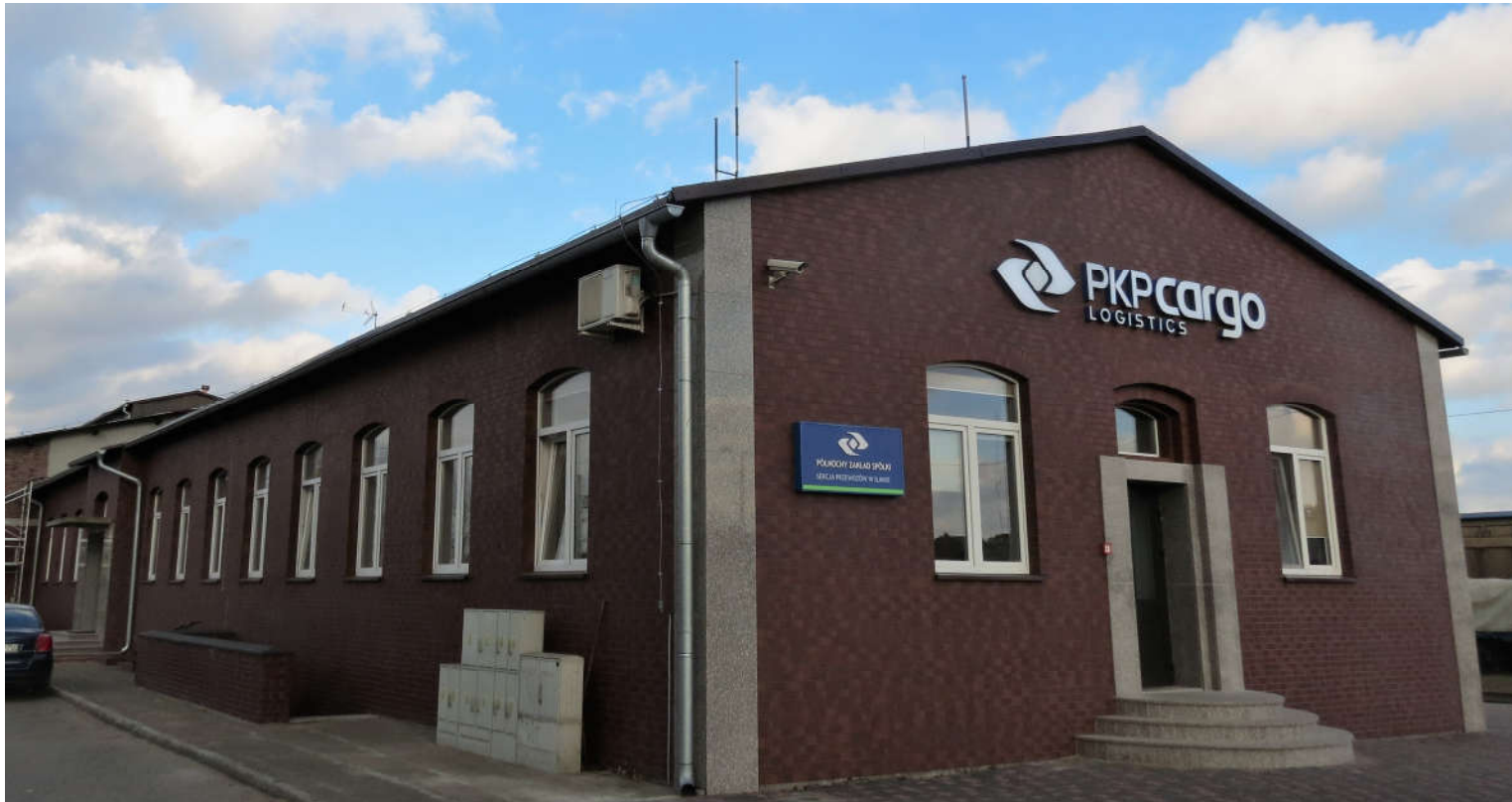
Widok ściany wzdłużnej i szczytowej z SW na NE

8. Fotografia z opisem wskazującym orientację: