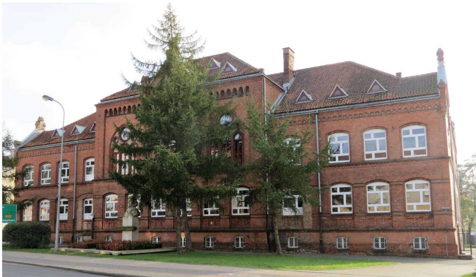
Widok ściany frontowej i szczytowej z N na S

8. Fotografia z opisem wskazującym orientację: