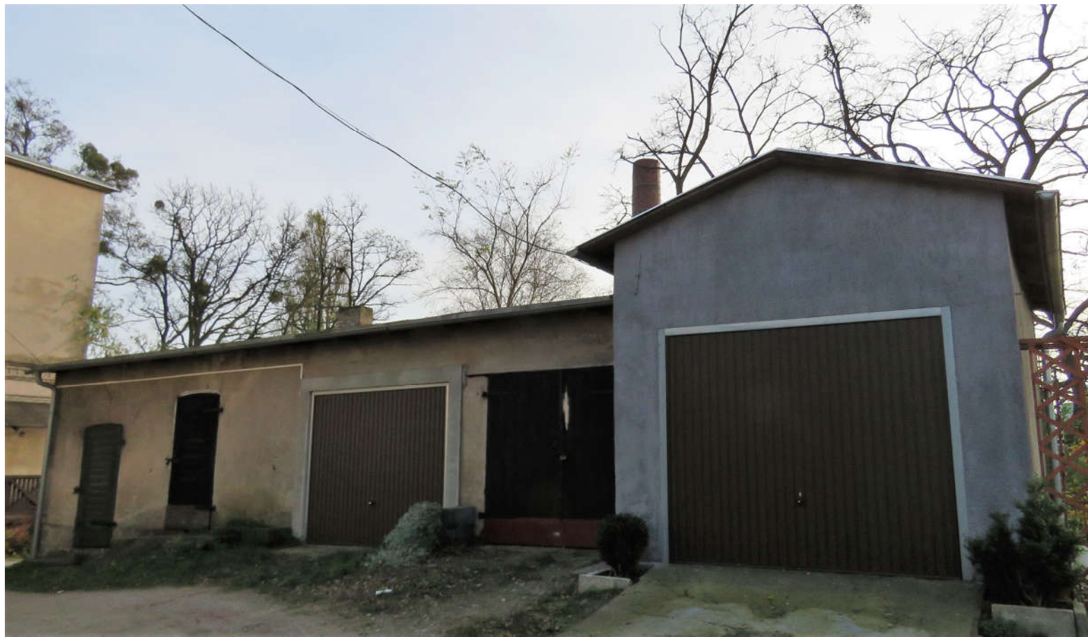
Widok ściany przedniej z NW na SE

8. Fotografia z opisem wskazującym orientację: