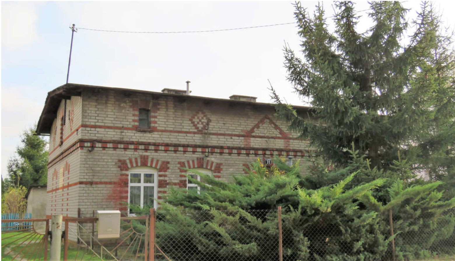
Widok ściany frontowej i szczytowej z N na S

8. Fotografia z opisem wskazującym orientację: