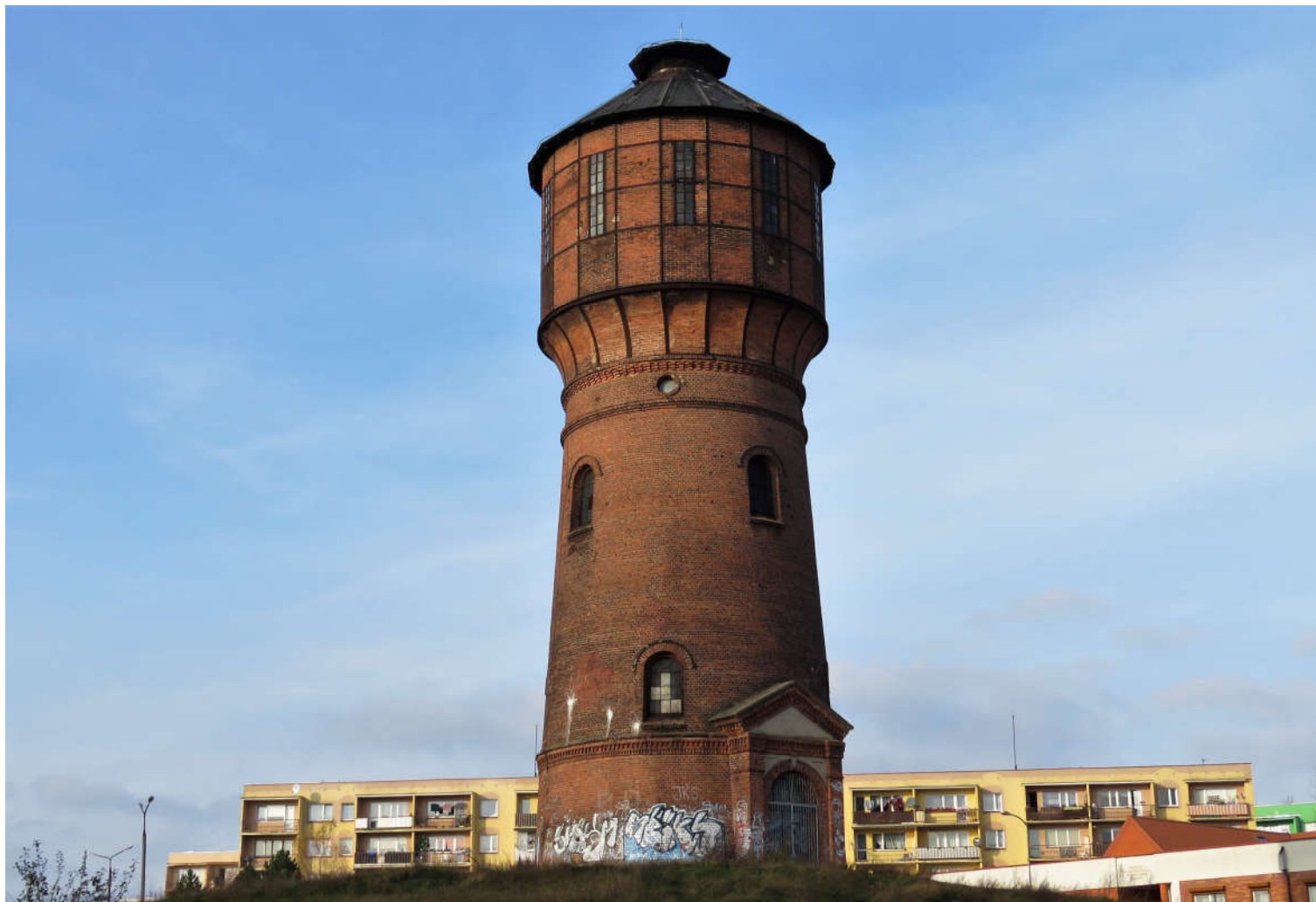
Widok wieży z SE na NW

8. Fotografia z opisem wskazującym orientację: