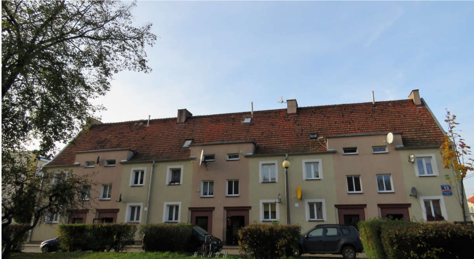
Widok ściany frontowej z SE na NW

8. Fotografia z opisem wskazującym orientację: