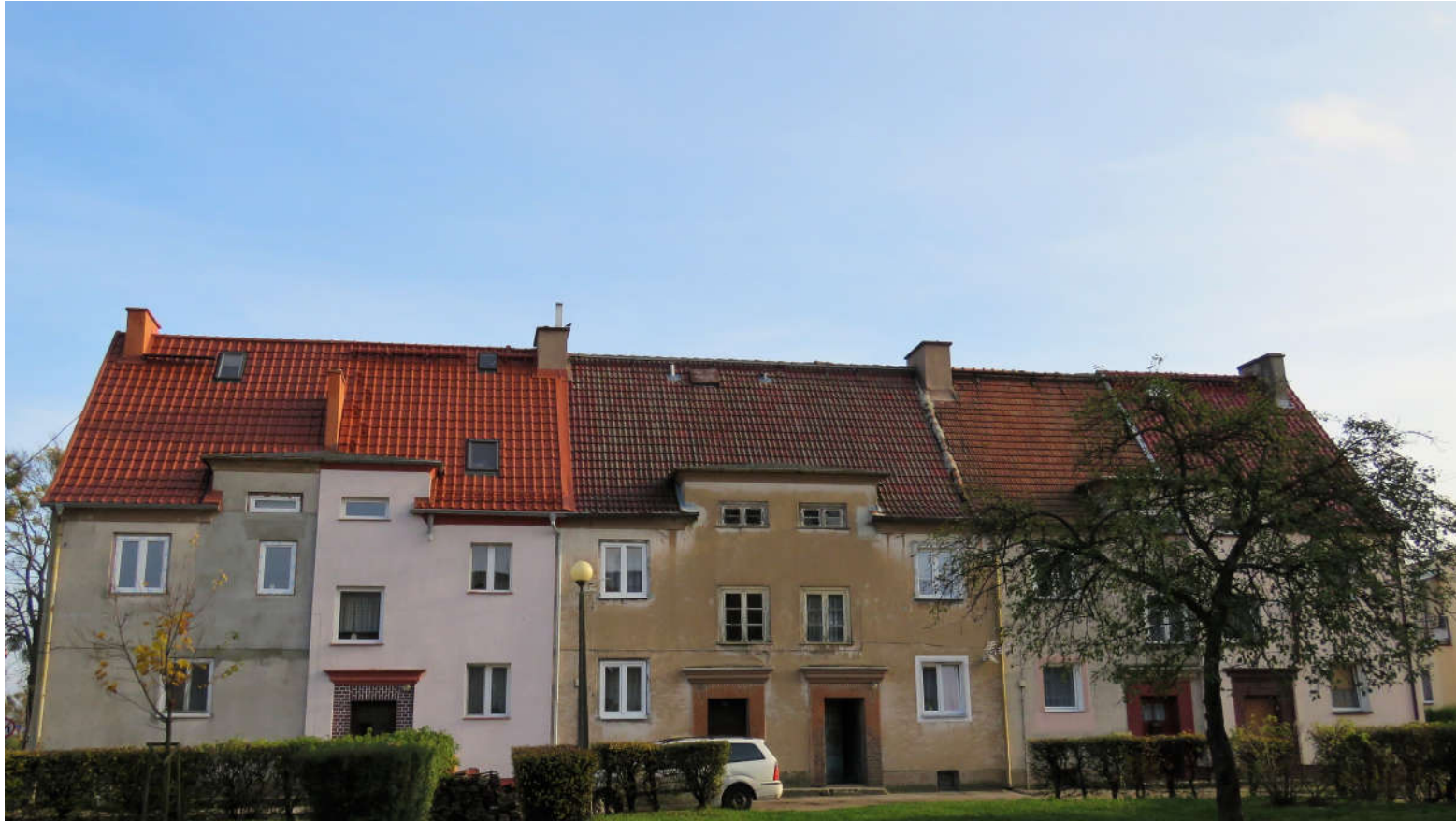
Widok ściany frontowej z NW na SE

8. Fotografia z opisem wskazującym orientację: