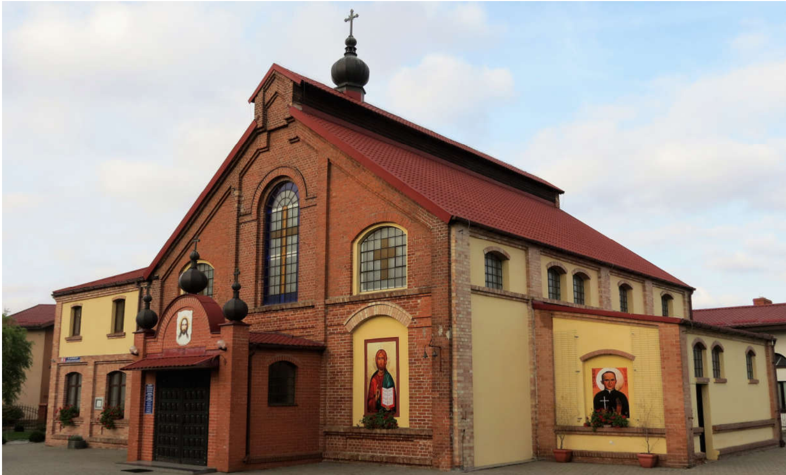
Widok bryły budynku z SE na NW

8. Fotografia z opisem wskazującym orientację: