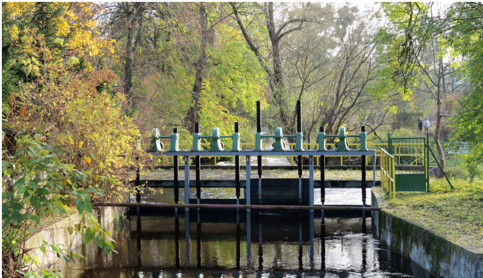
Widok jazu z S na N

8. Fotografia z opisem wskazującym orientację: