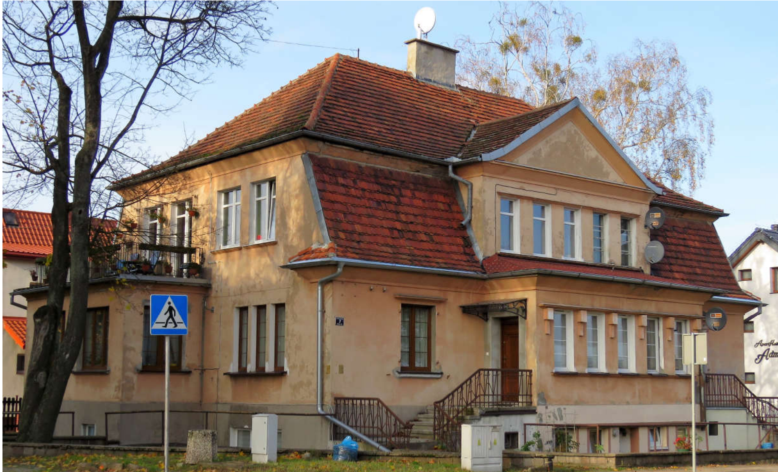
Widok ściany frontowej i szczytowej z SE na NW

8. Fotografia z opisem wskazującym orientację: