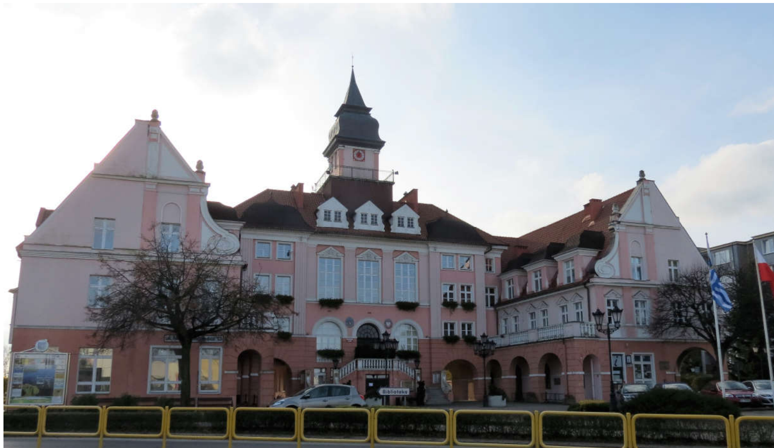
Widok fasady z N na S

8. Fotografia z opisem wskazującym orientację: