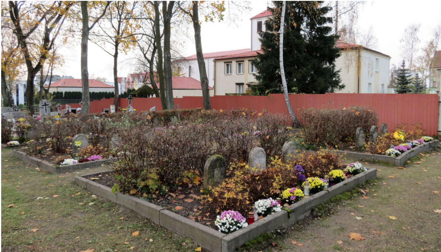
Widok kwatery wojennej z czasów I wojny światowej z E na W

8. Fotografia z opisem wskazującym orientację: