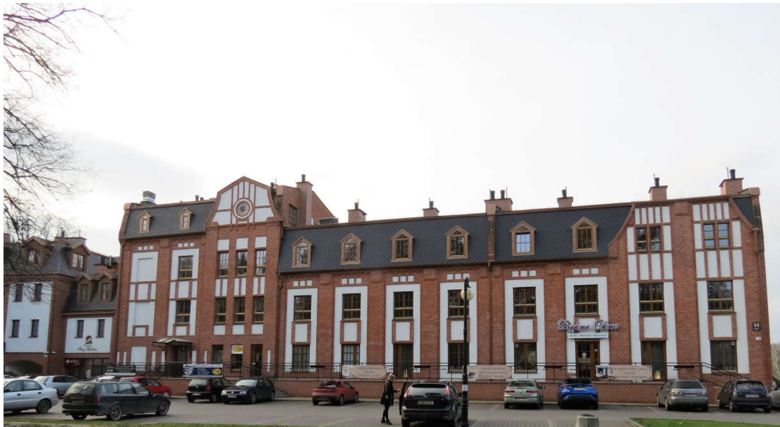
Widok ściany frontowej z E na W

8. Fotografia z opisem wskazującym orientację: