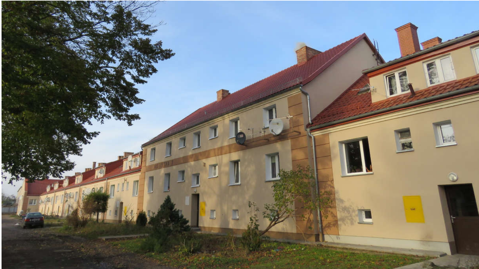
Widok ściany frontowej z SE na NW

8. Fotografia z opisem wskazującym orientację: