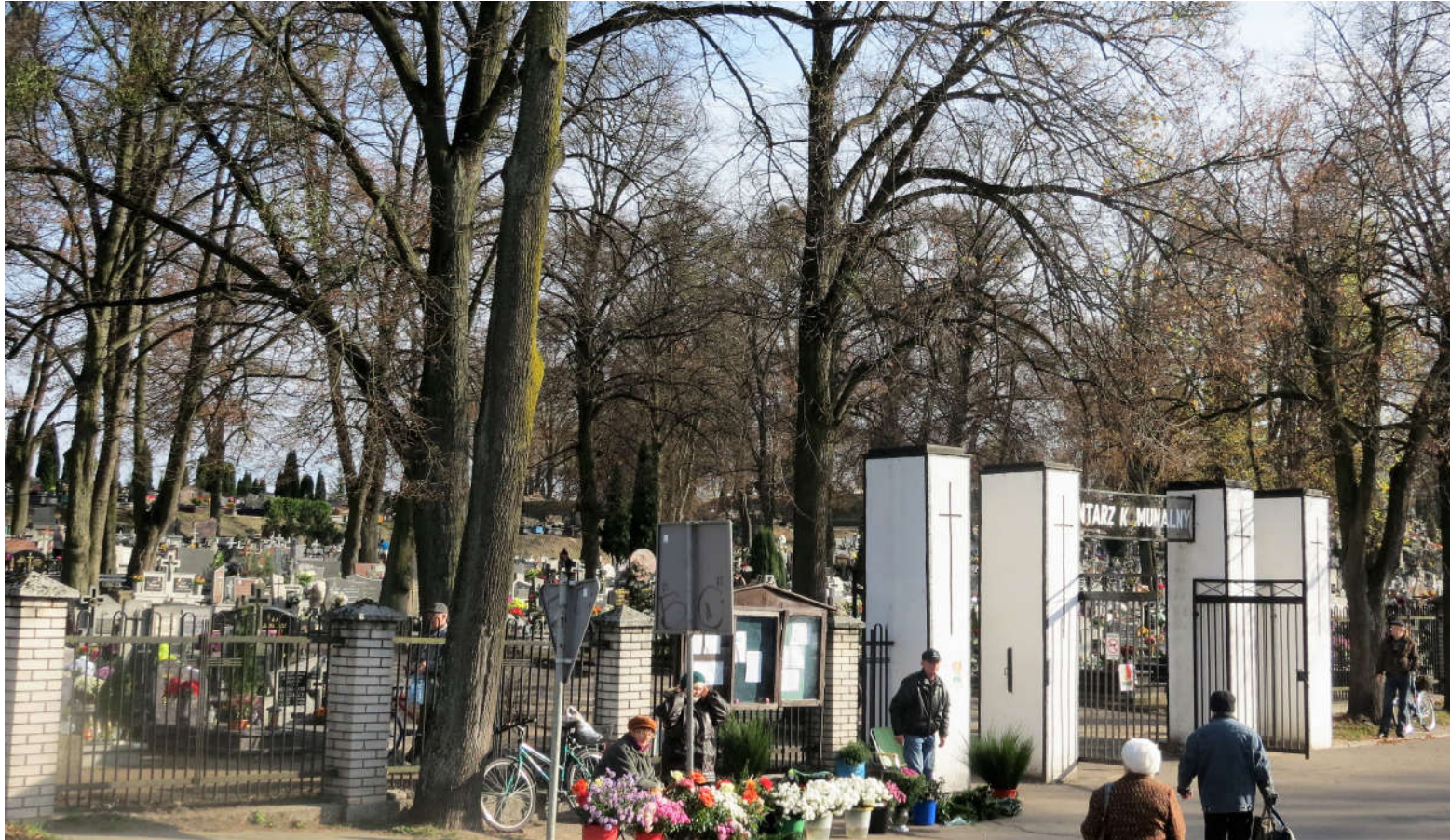
Widok bramy wejściowej na teren cmentarza z N na S

8. Fotografia z opisem wskazującym orientację: