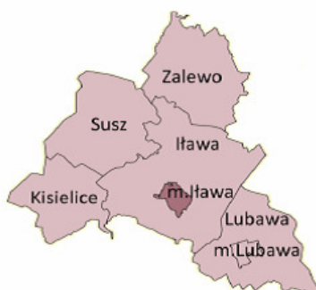
Położenie Miasta Iława w powiecie iławskim